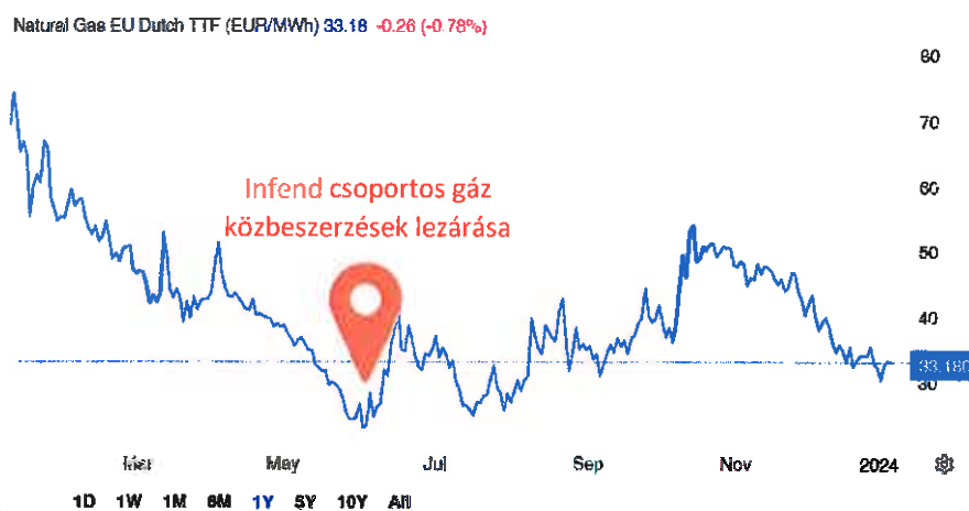
1. ábra: Földgáz piaci ár 2024. január

indukálja a fűtés iránti keresletet. Párizstól Berlinig fagyponthoz alatti hőmérséklet várható, mely január közepéig tart. Emellett a gáztüzelésű erőművek kihasználtsága valószínűleg növekedni fog, mivel a megújuló energia termelése az előrejelzések szerint csökkenni fog. A gázmérlegre gyakorolt hatás azonban korlátozott lesz, mivel a tárolók továbbra is telítettek maradnak a szokásosnál, és elegendő mennyiséget szállítanak csővezetéseken és tartályhajókon keresztül. Az Európai Unióban, így Németországban, Franciaországban és Olaszországban a gáztárolási szint 2024 januárjában 81% és 91% között mozog.