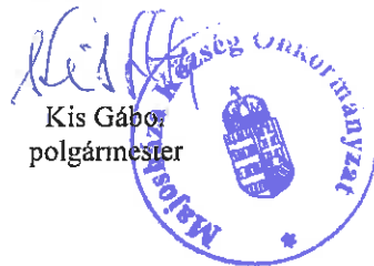
Kis Gábor polgármester

(3) E rendelet a belső piaci szolgáltatásokról szóló, az Európai Parlament és a Tanács 2006/123 EK irányelvnek való megfelelést szolgálja.