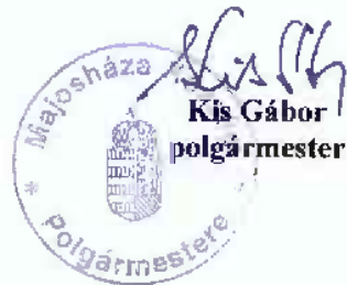
Kis Gábor polgármester