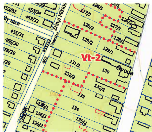
Szabályozási Terv részlete

A Majosháza, 130 és 131/1 hrsz-ú ingatlanok Majosháza Község Önkormányzata Képviselő-testületének Majosháza Építési Szabályzatáról szóló 10/2015. (IV.30.) ök. rendeletben és mellékletét képező Szabályozási Terven (a továbbiakban: HÉSZ és SZT) Vt-2 jelű településközponti vegyes területen találhatók.